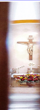
Imagen tomada por la grieta de las puertas del vestíbulo de San Pio X Jamul.